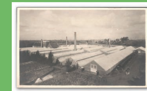
Bloemisterij Robert Cornelis - Hundelgemsesteenweg 57

De fraaie woningen kregen veelal klinkende namen, geïnspireerd op de bloemen- en plantenteelt.